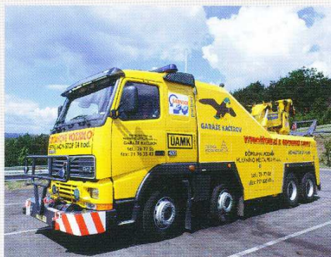
Speciální vyprošťovací vozidlo DP-Autobusy bylo zařazeno do Jednotného bezpečnostního systému hl. m. Prahy.

Pro zabezpečení vyproštění a odtahu havarovaných vozidel disponuje DP-Autobusy speciálním zařízením na podvozku Volvo FH 12. Toto speciální vozidlo bylo zařazeno do Jednotného bezpečnostního systému hlavního města Prahy a je k dispozici Policii České republiky, Hasičskému sboru a dalším složkám Jednotného bezpečnostního systému.