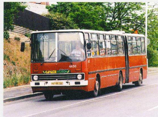
První kloubové autobusy Ikarus 280.08 byly zařazeny do provozu v roce 1977. Vůz číslo 4450 jezdí od roku 1989.