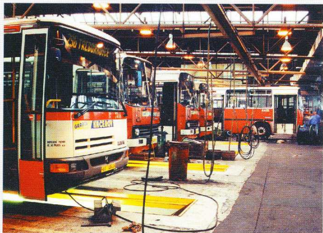
Nízkopodlažní autobus Neoplan N 4014/3 z roku 1995.