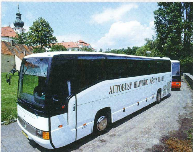
Zájezdovou dopravu zajišťuje DP nejmodernějšími autobusy, mezi které patří například Mercedes Benz O 350.