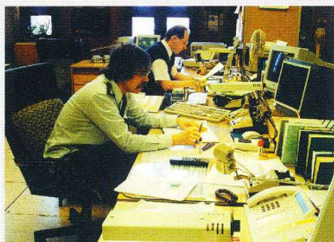
Autobusový dispečink očekává v blízké budoucnosti zásadní modernizace.

Dispečink DP-Autobusy je při řízení dopravy podřízen Centrálnímu dispečinku akciové společnosti, jehož prostřednictvím je zajištěna koordiná-