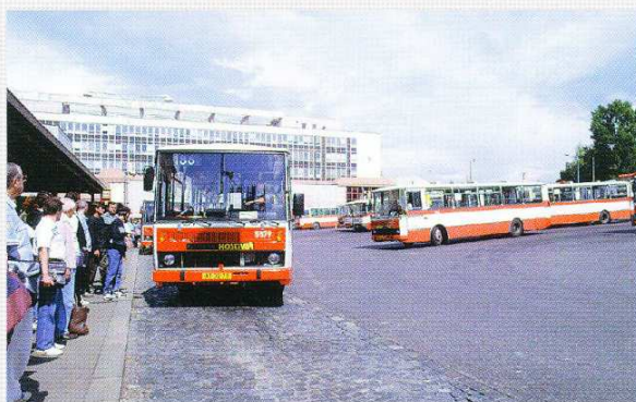
Odstavná plocha autobusového terminálu u stanice metra Českomoravská.

V nepravidelné dopravě se DP-Autobusy zaměřuje na vysokou kvalitu nabídky a ve vozovém parku jsou proto autobusy Mercedes O 350