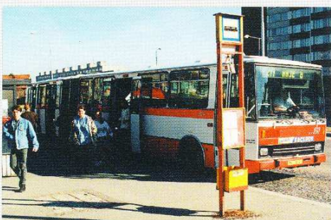
Kloubový autobus Karosa B741 z roku 1996.

sítě, např. na Vysočanské estakádě, v úsecích ulice Tábořské, na náměstí bratří Synků, v ulici Strakonické mezi Barrandovským mostem a Nádražní, a v Zenklově ulici v úseku Okrouhlická – Kobyliské náměstí. Připravuje se vyhrazený jízdní pruh v ulici V Holešovičkách v úseku Vychovatelna – Jankovcova. Pro zlepšení průjezdnosti světelně řízených křižovatek se připravují opatření umožňující preferovat provoz městských autobusů.